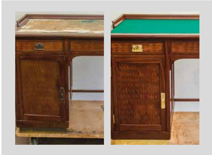
Vor- und Endzustand

Anfang 20. Jahrhundert, Privatbesitz, Konstruktion: Eiche, Nadelholz, Furnier: vermutlich Mahagoniart