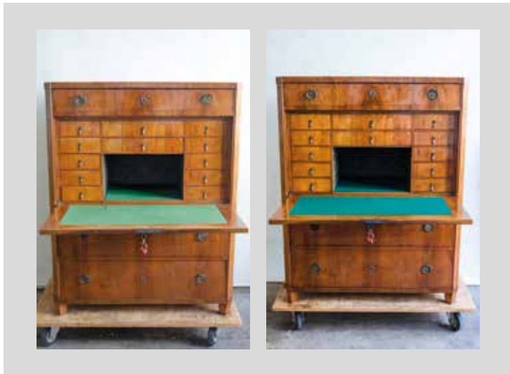
Vor- und Endzustand

1. Viertel 19. Jahrhundert, Österreich, Privatbesitz, Konstruktion: Nadelholz, Furnier: Nussbaum