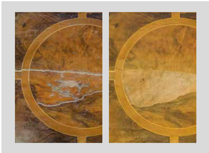
Vor- und Zwischenzustand

ca. 1. Viertel 18. Jahrhundert, Privatbesitz, Konstruktion: Nadelholz, Furnier: Nussbaum und andere