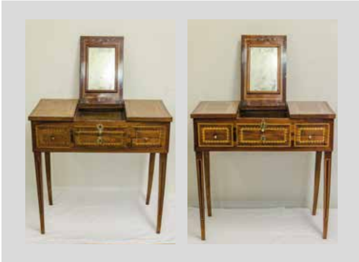
Vor- und Endzustand

Konstruktion: Eiche und evtl. andere, Marqueterie: diverse exotische und gefärbte Hölzer