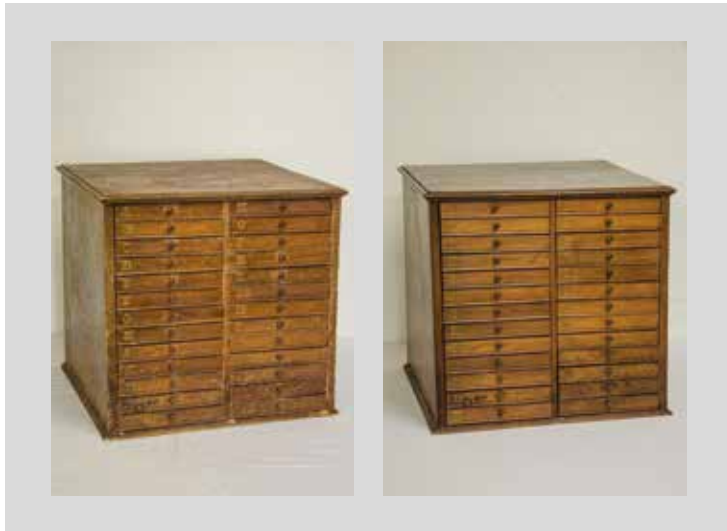
Vor- und Endzustand

vermutlich letztes Viertel 19. Jahrhundert, Inventar Basler Mission, Konstruktion: Nadelholz