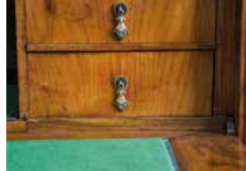
Vorzustand: Abgenutzte Schubladenseiten und Laufleisten beeinträchtigen die Funktionalität der Schublade. Sie führen zu unerwünschten Kon- taktzonen, welche die Furnierung an der Schubladenfront und die Schubladeneinfassung schädigen.