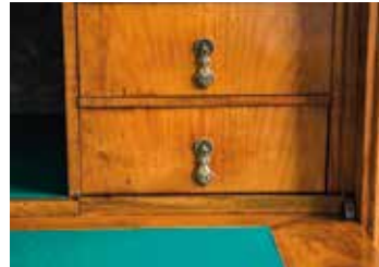
Endzustand: Überarbeitete Schublade. Die schädigende Kontaktzone konnte durch Überarbeitung der Schublade- seiten und Laufleisten behoben werden.