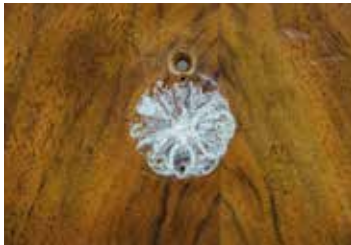
Zwischenzustand: Unter dem demontierten Ringgriff befinden sich weisse Rückstände von Metallputzmittel, die sich über Jahre angesammelt haben.